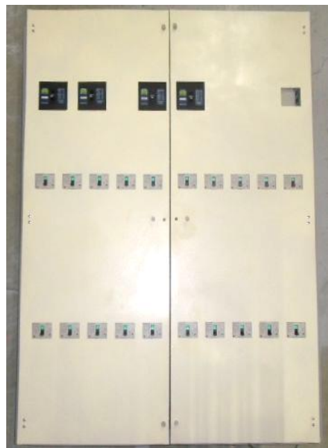
L : 1200mm H : 1650mm W : 250mm