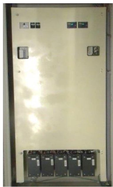
L : 800mm H : 1650mm W : 250mm